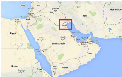
Kuwait og Mellemøsten