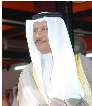
Premierminister Jaber Al-Mubarak Al-Hamad Al-Sabah.