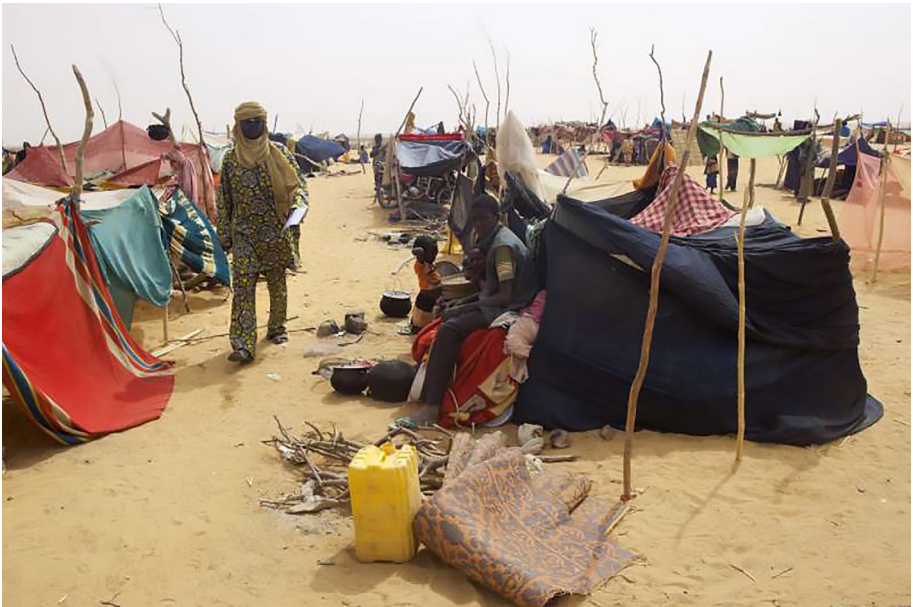
Flygtningelejr i Gao.

En anden vigtig opgave for MINUSMA er beskyttelse af 'civile objekter', det vil sige kulturelle mindesmærker og hellige steder, transportknudepunkter med mere.