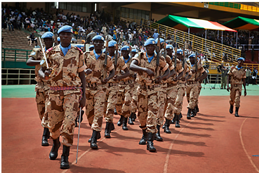
Parade. Chadstyrker i MINUSMA.