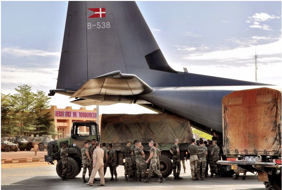
Danske og franske styrker i Timbuktu i 2013.

MINUSMA består af personel fra hele verden, og de militære styrker er ligeledes en god blanding af forskellige nationaliteter. Læs mere på MINUSMA's hjemmeside (link bagerst i folderen).