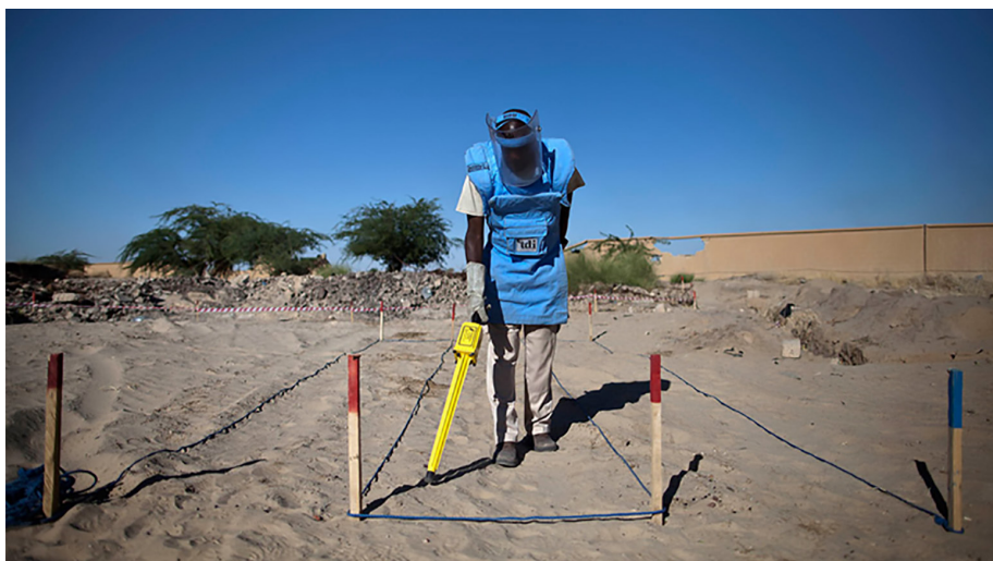
Minerydder fra MINUSMA på arbejde i Timbuktu.

Det er MINUSMA's rolle at støtte og monitorere våbenhvileaftalerne mellem de forskellige parter og rapportere eventuelle overtrædelser til FN's Sikkerhedsråd. MINUSMA skal også støtte implementeringen af den seneste fredsaf-tale med hovedvægt på afvæbning af militante grupperinger især i det nordlige Mali og reintegration af medlemmer af væbnede grupper.