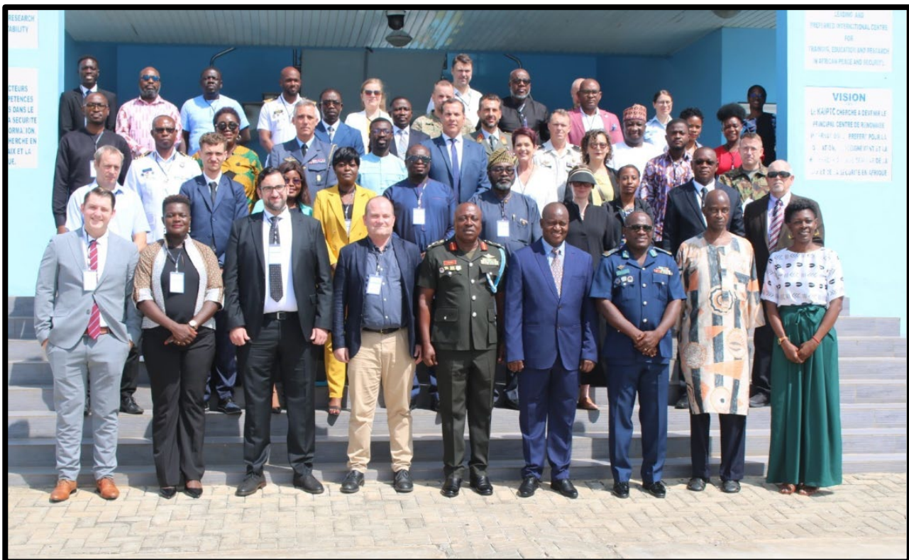
Maritime Security Conference blev afholdt i rammen af Freds- og Stabiliseringsfonden, og inkluderede samarbejdspartnerne Kofi Annan International Peace Training Center (KAIPTC), Ghana, og Security Institute for Governance and Leadership in Africa (SIGLA) ved Stellenbosch University, Sydafrika.

En af hovedkonklusionerne fra konferencen var, at maritim sikkerhed er andet og mere end pirateri. Antallet af piraterihændelser er stærkt faldende, dog ikke forsvundet, hvorfor dette "fredsvindue" skal bruges på at identificere værktøjer, som kan bidrage til at adressere andre udfordringer. Her især, ureguleret og ulovligt fiskeri, som er et stort problem for regionen. Det er et eksempel på, at maritime trusler skal ses som et mere sammenhængende billede, hvor forskellige trusselselementer forstærker og påvirker hinanden. En mere holistisk tilgang med et bredere fokus er derfor ikke blot god – men nødvendig for at sikre en stabil udvikling i regionen. Yderligere information om konferencen kan findes på fak.dk – hvor man også kan finde communiquéet.