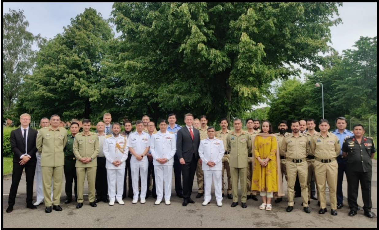
NDU delegation, FAK Dekan og CFS på FAK til seminar dag.

Fra d. 6. til d. 12. juni besøgte en delegation fra Pakistans National Defence University (NDU) Danmark og FAK. Studieturen indeholdt både faglige og kulturelle indslag. De faglige aktiviteter omfattede blandt andet briefinger af Forsvarskommandøen og Forsvarsministeriet, besøg ved Systematic A/S og Terma A/S samt et seminar på Forsvarsakademiet. Seminaret centrerede sig om dansk sikkerhedspolitik, den vestlige tilbagetrækning fra Afghanistan og krigen i Ukraine. Derudover bestod programmet også af kulturelle indslag heriblandt en reception arrangeret af den pakistanske ambassade til Danmark, en middag og rundvisning på Frederiksberg slot samt en guidet tur ved Houvig bunkerne i Vestjylland. For yderligere information se nyhedsopslag på fak.dk .