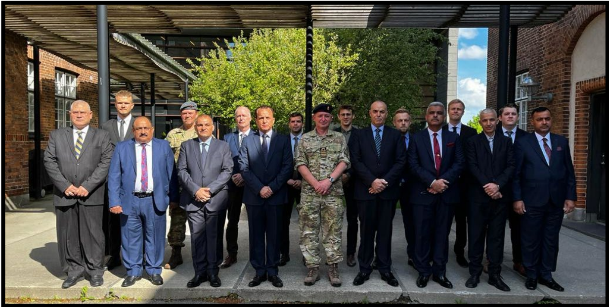
Delegationen fra DUHMS og CFS til seminar dag på FAK i forbindelse med studietur