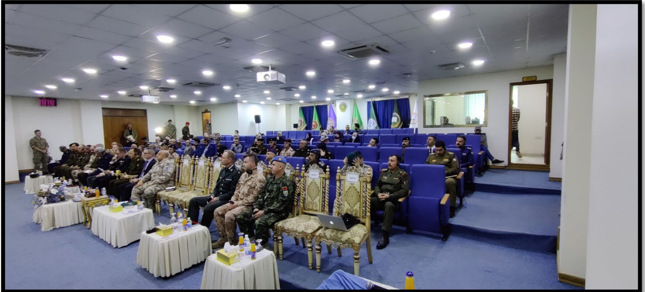
Konferencen i Bagdad i december 2022.

anvendes i FAKS undervisning og forskning. Konferencen blev afviklet med støtte og koordination fra NMI og NATO DEEP og medvirkede til et udvidet netværk blandt irakiske partnere, men også i NATO For yderligere info se nyhedsopslag på fak.dk .