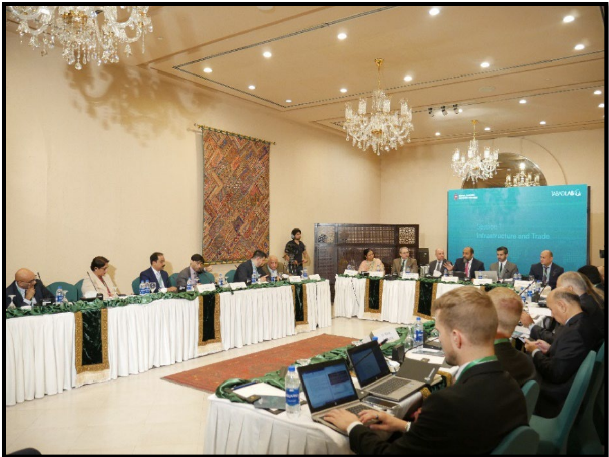
Fra konferencen Afghanistan Regional Collective (ARC) Dialogue i september 2022